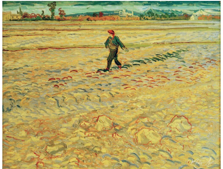
Vincent van Gogh. Såmannen (The Sower) , 1888.