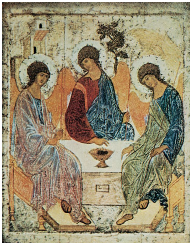
Andrej Rubljov, Den hellige treenighet , ca. 1411–1427.

Gud, du som er én og treenig, jeg takker deg for den hellige dåp, som har gjort meg til en del av din familie.