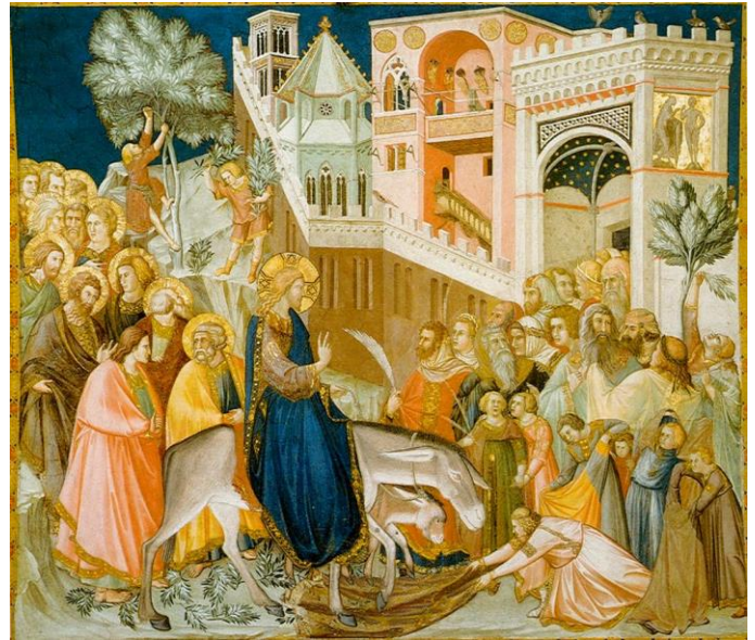
«Inntoget i Jerusalem» av Pietro Lorenzetti ca. 1280 – 1348